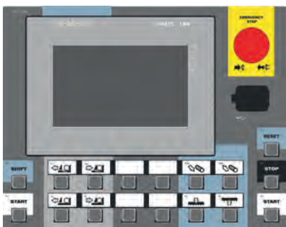
CONTROL PANEL: SIEMENS (X)